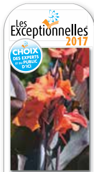
Canna 'Ebony Patra' lesexceptionnelles.ca