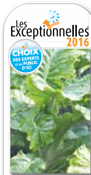
Alocasia 'Low Rider™' lesexceptionnelles.ca